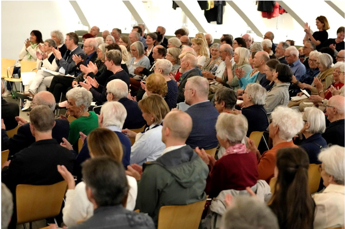
Applaus bei der Eröffnung der Ausstellung Töne für die Seele , 29. April.

Die Referenten und Musikerhonorare, welche von der Stiftsbibliothek ausgerichtet werden, entsprechen immer mindestens den von den Branchenverbänden empfohlenen Ansätzen.