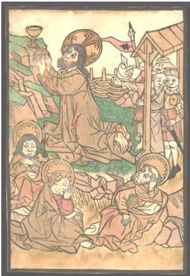
Christus am Ölberg, Anonymer Holzschnitt, Süddeutschland, Elsass oder Schweiz 1450/1480 Unikat, neu greifbar auf e-rara.

2025 liess die Stiftsbibliothek weitere unikal überlieferte Drucke von e-rara digitalisieren und auf der Plattform für digitalisierte Drucke aufschalten. Dabei handelt es sich um elf Einblattdrucke, wovon acht aus der Sammlung Kemli stammen, sowie um einen bislang übergangenen St.Galler Klosterdruck. Die Einblattdrucke wurden der Koordinationsstelle des Gesamtkatalogs der Wiegendrucke gemeldet, sodass von deren Einträgen ebenfalls auf die Digitalisate verlinkt werden kann. Die Digitalisate der Stiftsbibliothek erhielten 2025 auf e-rara 3'495 Visits und 4'320 Pageviews (2024: 3'789 Visits und 4'694 Pageviews).