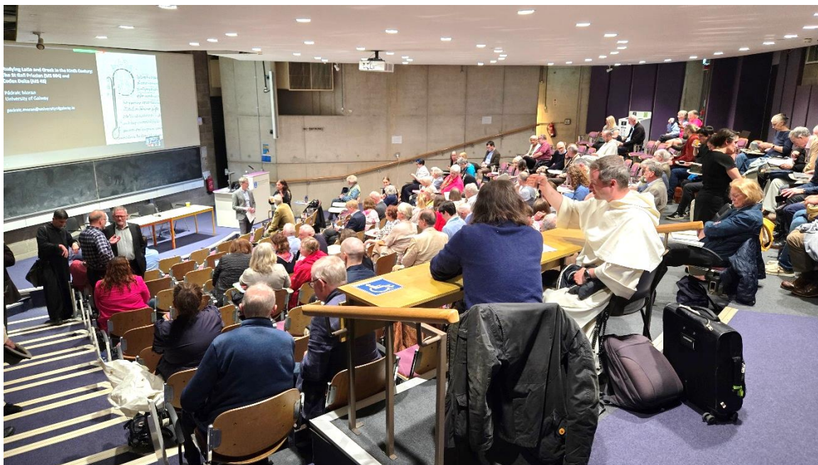
Volle Ränge zur Tagung über St.Galler Handschriften im Trinity College, Dublin, 16. Juni.