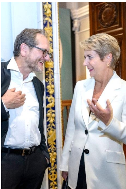
Stiftsbibliothekar Cornel Dora mit Bundespräsidentin Karin Keller-Sutter bei der Ausstellungseröffnung von Words on the Wave in Dublin, 29. Mai.

Wichtigstes betriebliches Projekt war der Einbau einer Lüftung und die Erneuerung der Beleuchtung im Barocksaal. Beides konnte erfolgreich umgesetzt werden. Dadurch konnten das Raumklima und die optische Präsentation des Barocksaals wesentlich verbessert werden.