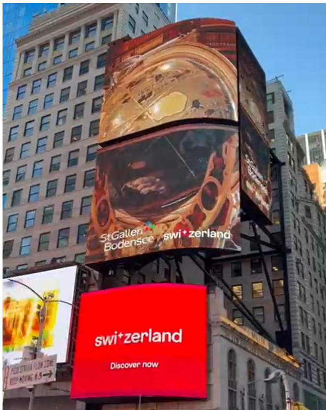
St.Gallen-Bodensee Tourismus mit Kathedrale und Stiftsbibliothek auf dem Times Square in New York, 13.–19. Oktober.

Vom 13. bis zum 19. Oktober 2025 lief auf dem Times Square in New York ein Videoclip, in dem Schweiz Tourismus mit der Kathedrale und der Stiftsbibliothek St.Gallen Werbung für das Kulturland Schweiz machte. Die Bibliothek ist, wie das Beispiel zeigt, kulturelles Kernstück und Zugpferd des Weltkulturerbes Stiftsbezirk St.Gallen. Mit ihrem positiven Image, der historischen Tiefe und optischen Attraktivität ist sie eine exzellente Botschafterin nicht nur für die Ostschweiz, sondern für unser ganzes Land.