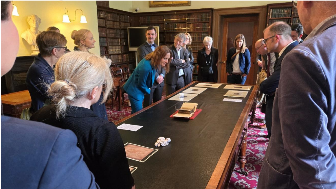
Ehrengäste aus der Schweiz erhalten Einblick in die Handschriftenschätze der Royal Irish Academy in Dublin, 30. Mai.

An der Ausstellung über die Bibel von Moutier-Grandval, die vom 8. März bis zum 8. Juni 2025 im Musée Jurassien d'Art et d'Histoire in Delsberg gezeigt wurde – ebenfalls ein Publikumserfolg – beteiligte sich die Stiftsbibliothek mit zwei substantziellen Handschriftenausleihen.