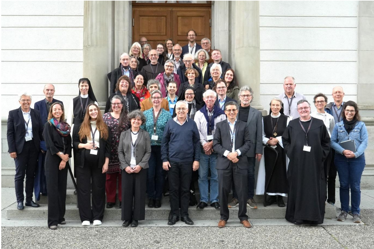
Konferenzfoto der Fachtagung Klosterkultur Zwischen Himmel und Erde – Musik im Kloster , 12. September.

Weitere Projekte der Fachstelle widmen sich der Webdatenbank Helvetia Sacra (Aktualisierung der Register-Daten) und der Ausbelichtung von Tiff-Dateien der e-codices-Handschriften auf Farbmikrofilm.