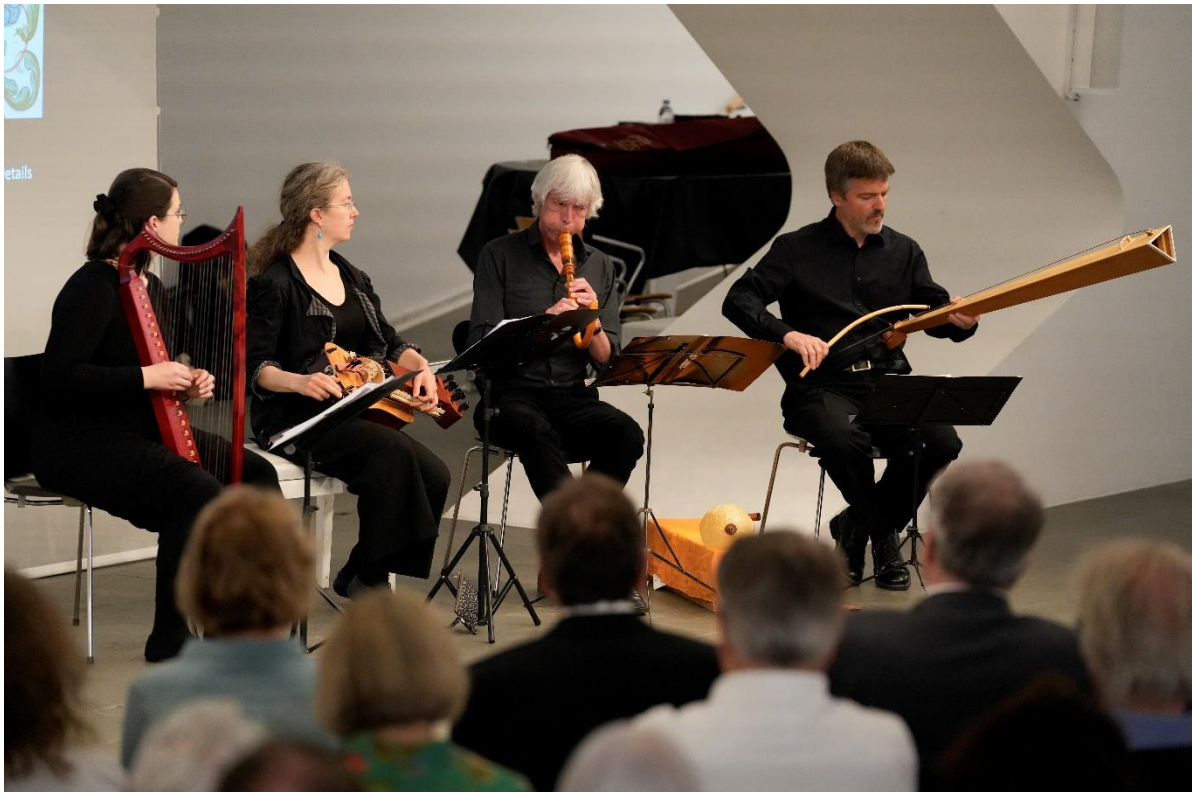
Historische Musik zur Eröffnung der Ausstellung Töne für die Seele , 29. April.