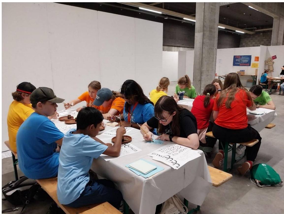
Minifest, 7. September.