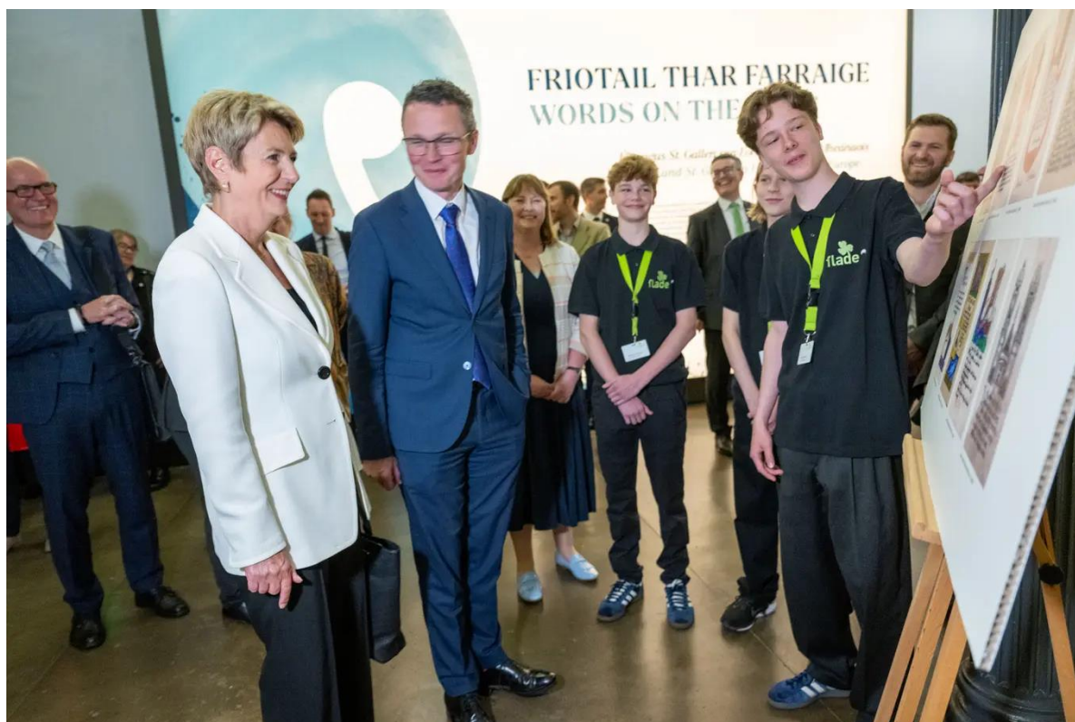
Schüler der Buebeflade präsentieren Bundespräsidentin Karin Keller-Sutter und dem irischen Kulturminister Patrick O'Donovan im Rahmen der Ausstellung Words on the Wave ihre Kunstwerke, Dublin, 29. Mai.

Mit der Ausstellung Words on the Wave – Ireland and St. Gallen in Early Medieval Europe im National Museum of Ireland in Dublin (29. Mai – 27. Oktober 2025) war die Stiftsbibliothek an einem grossen irisch-schweizerischen Kooperationsprojekt beteiligt. 19 wertvolle frühmittelalterliche Handschriften der Stiftsbibliothek aus oder mit Bezug zu Irland wurden dazu nach Dublin ausgeliehen, erstmals seit mehr als 1000 Jahren. Im Rahmen eines Schulprojekts waren auch Schüler der flade einbezogen. Ergänzend organisierte das Trinity College Dublin am 16. Juni eine sehr gut besuchte eintägige wissenschaftliche Konferenz zu den Handschriften der Stiftsbibliothek, und auch die 10. International Insular Art Conference in Cork (2.–5. Juli) widmete St.Gallen ein Panel. Mit 122'000 Eintritten war Words on the Wave die bisher meistbesuchte Wechselausstellung des National Museum of Ireland, ein grosser Erfolg für alle Beteiligten. Ab Januar 2027 soll die Ausstellung in angepasster Form im Landesmuseum Zürich gezeigt werden.