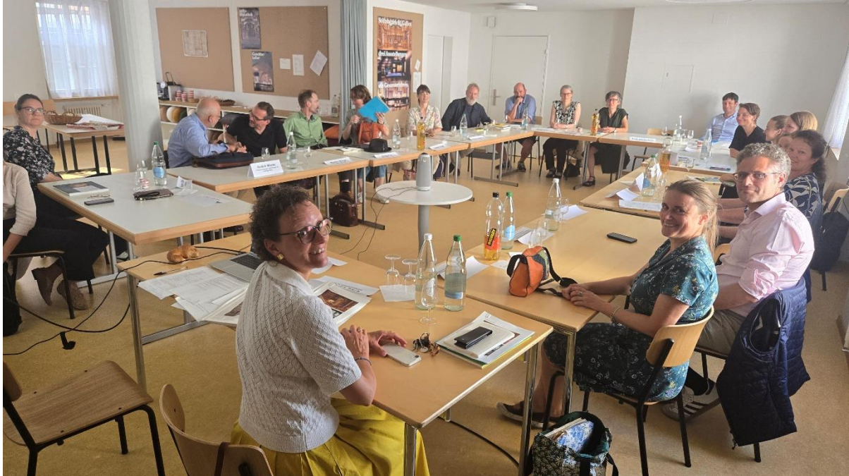
Expert Talk on Mummies im Vermittlungsraum der Stiftsbibliothek, 29. August.

Vom 13. bis 15. September begrüßte die Stiftsbibliothek zu den 4. Fachtagen Klosterkultur mit dem Thema Musik im Kloster (dazu im nächsten Kapitel zur Fachstelle kirchliches Kulturerbe).