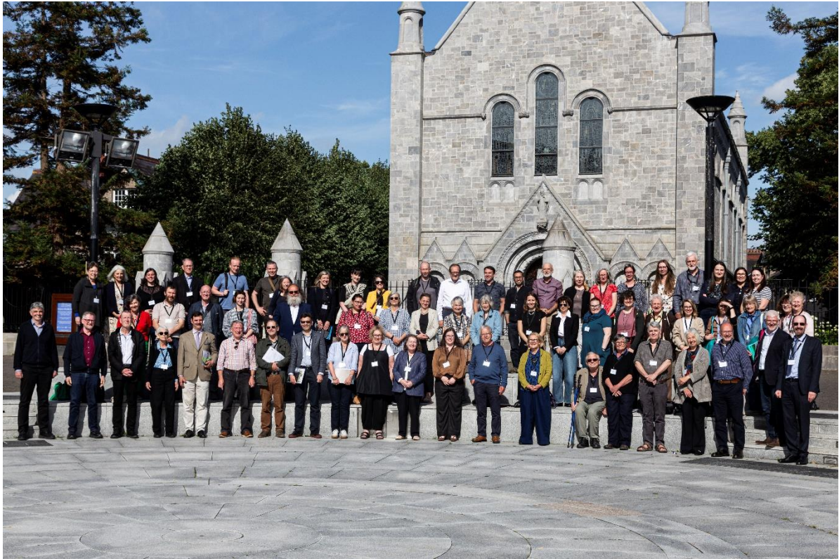
Insular Arts Conference, Universität Cork, 3. Juli.