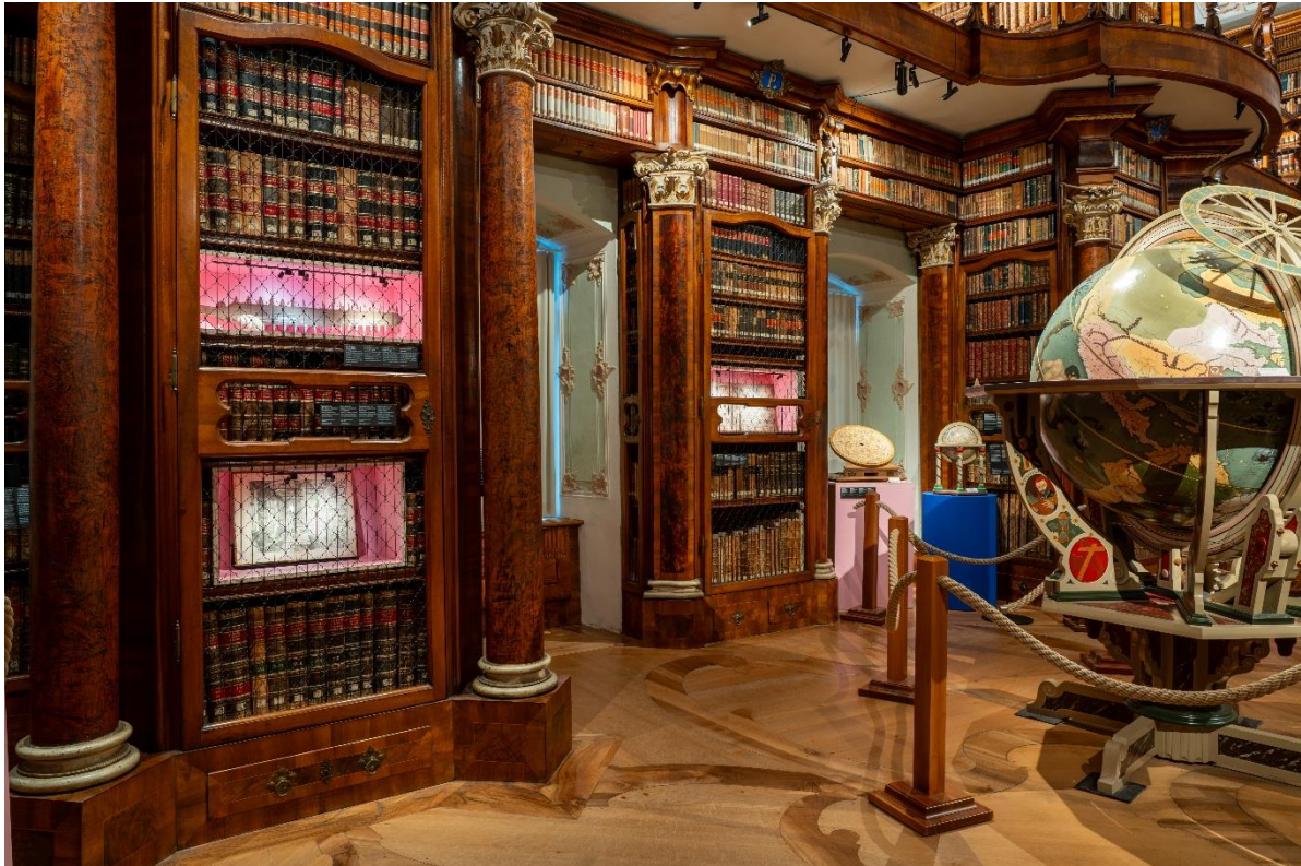
Die Ausstellung Wunderkammer Stiftsbibliothek setzte farbige Akzente.