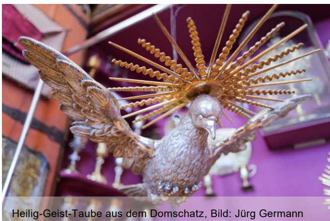
Heilig-Geist-Taube aus dem Domschatz

Der Haughk-Kelch ist ein prachtvoller, üppiger Rokoko-Kelch aus dem Jahr 1753. Er spielte bei der Bischofswahl eine wichtige Rolle, wurden in ihn doch die Wahlzettel gelegt. In der Liturgie der Bischofsweihe war der Kelch dann für die Eucharistie in Verwendung.